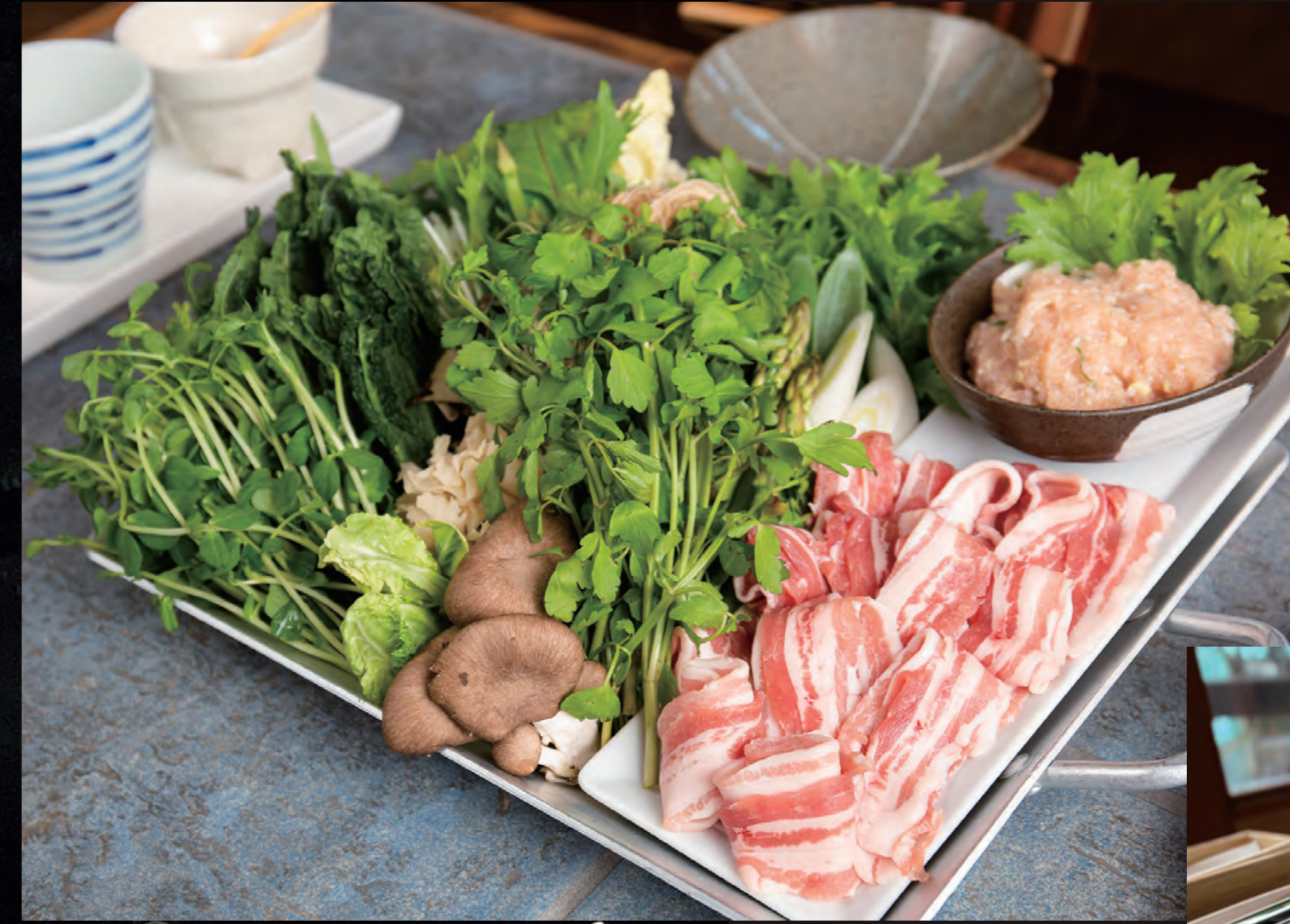
Fresh vegetables from Gunma, Enjoy plenty of seasonal ingredients. "Nabe" (Japanese stew) , barbeque etc...